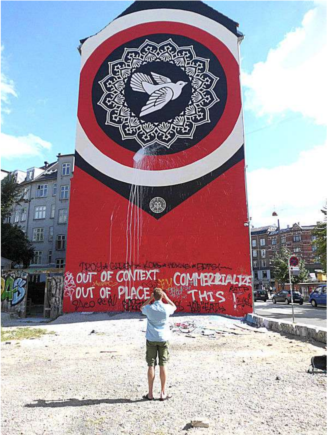
Sådan så gavlen ud 6. august. Men det varede kun til dagen efter. Så gik et nyt hold i gang.