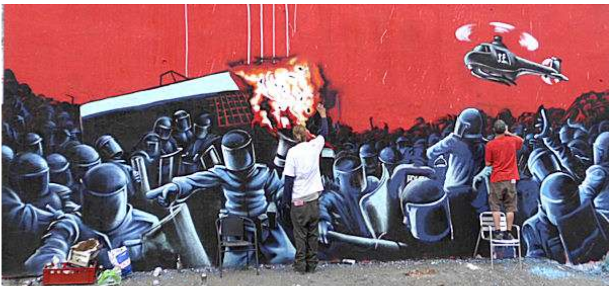
Søndag formiddag 7. august 2011 så nederste del af gavlen ud som herover. Vi kigger forbi de kommende dage for at se, om der sker mere på gavlen.