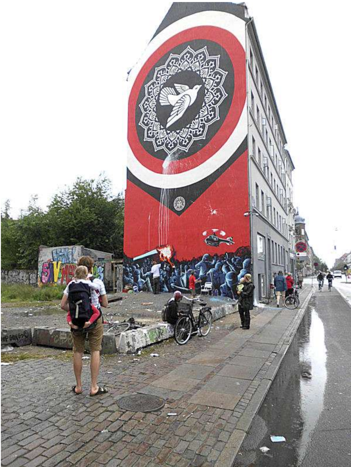
Søndag den 7. august om formiddagen arbejdede to unge mennesker på gavlen, som nu blev befolket med politiets stormtropper og helikopter. Og det blev gavlen ikke ringere af.