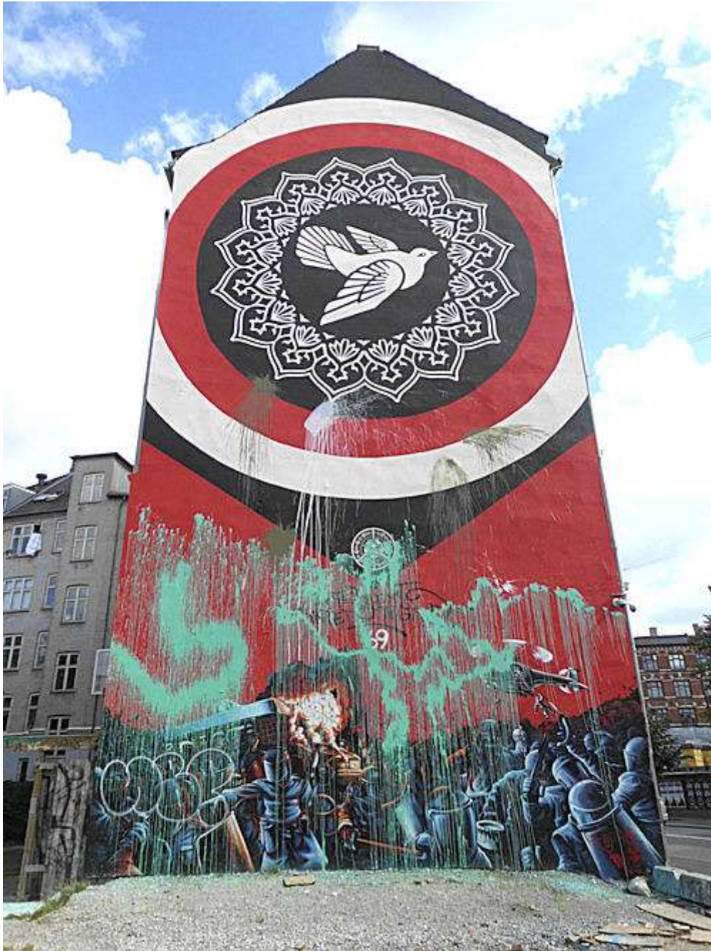
Gavlen på Jagtvej 69 får næppe fred. 16. august 2011 fik gavlen en ny omgang maling klasket op. Har »hærværksfolkene« forsøgt at lave hagekors? Det kunne godt lige noget i den retning. Der skal såmænd nok komme mere på endnu.